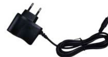
Fuente de alimentación